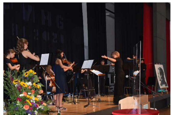
Musikalische Umrahmung durch unser Orchester