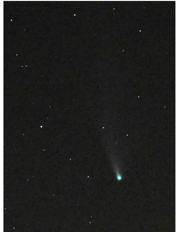
Der Komet Neowise über Waldenbuch letzte Woche