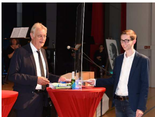
Zeugnisübergabe durch Schutzscheibe